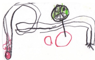
Ilyda, 5 Jahre